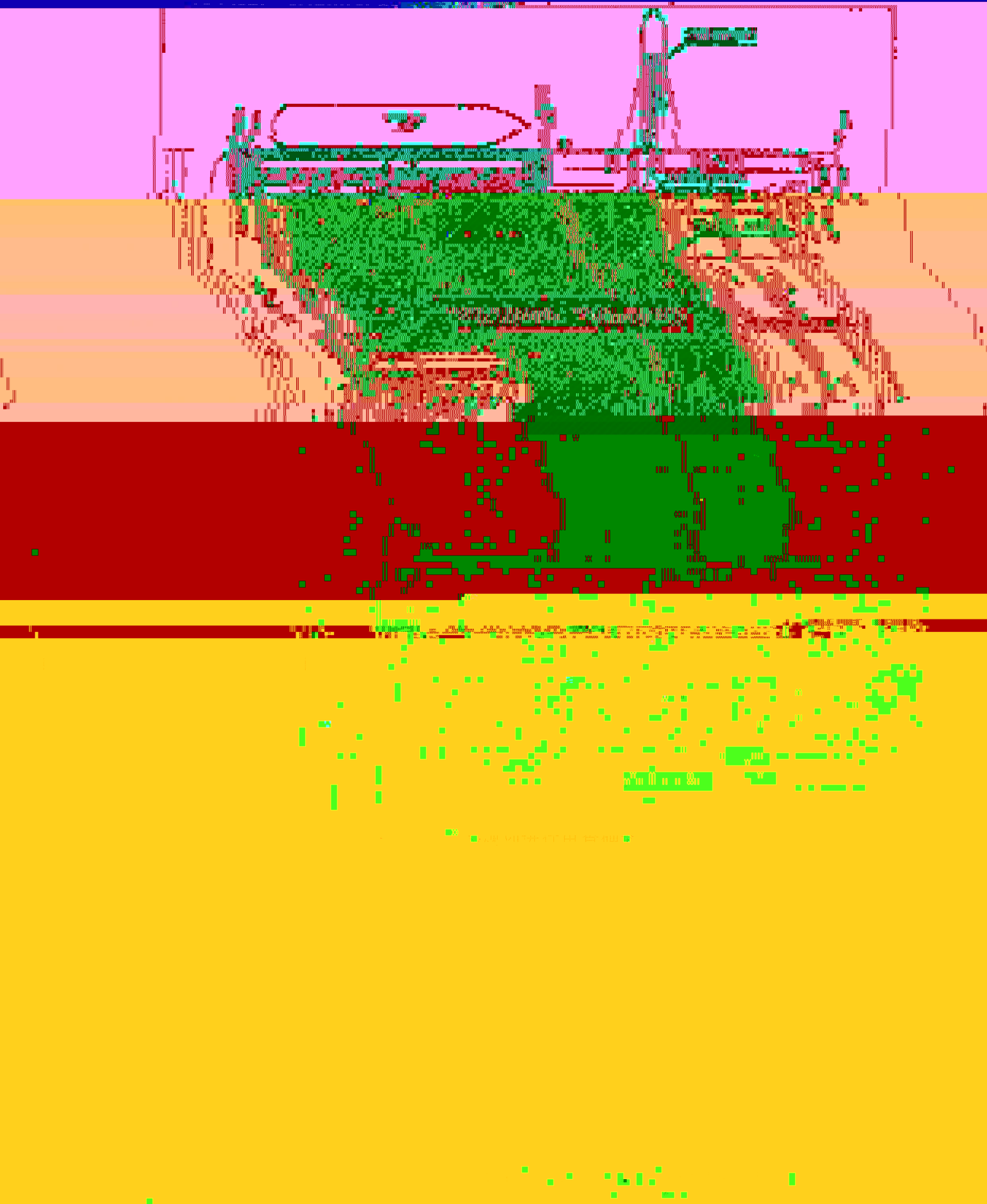
附图 3. 砚斗内部拟租用 0#泊位与闲置场地使用计划示意图